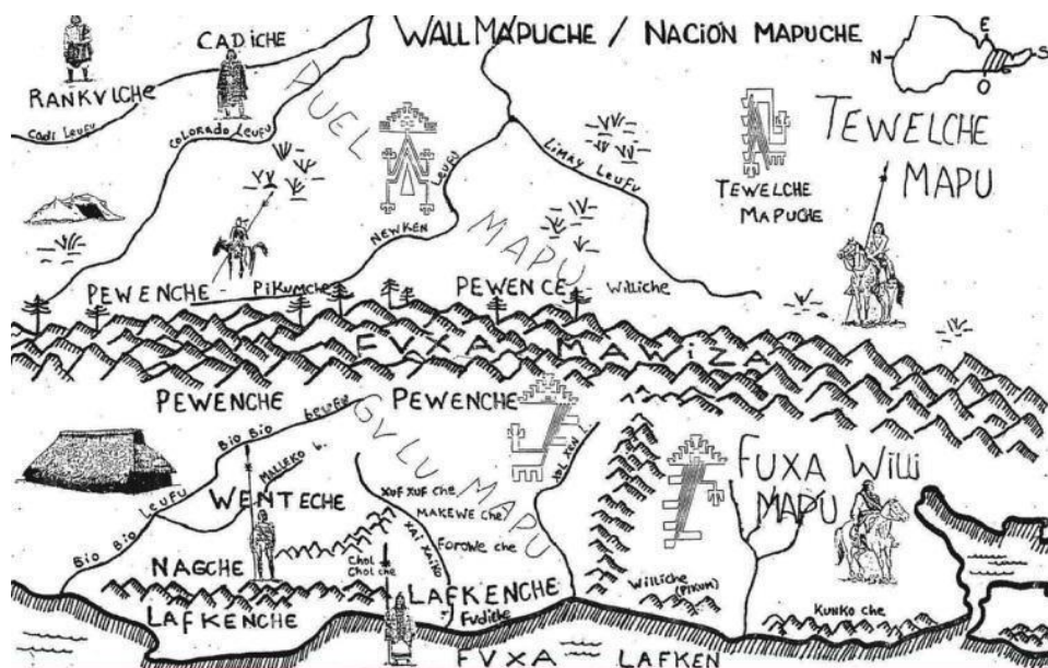
Figura 1: Ilustración de: Pablo Marimán, historiador Mapuche (2018)

Los proyectos de mapeo buscan el reconocimiento del territorio ancestral bajo la noción de propiedad y autonomía donde circulan un sin número de tradiciones que se encuentran fuertemente vinculadas con la naturaleza. El medio ambiente hace parte de las luchas por la recuperación de los lugares. En tal sentido, el mapeo identifica principalmente las zonas de minerales, ríos y glaciales para su protección. Siguiendo el mapeo que realizó la comunidad mapuche en la Región de los Ríos, límites con Argentina, en el 2017, se identifica aquí las zonas de asentamiento indígenas, los terrenos de producción agrícola, los ríos y valles que transitan en este territorio. En este sentido, la tierra no es solamente el lugar donde habita una comunidad, sino el espacio territorial donde fluye la existencia de la vida humana y natural. Observemos la siguiente cartografía en la Figura 1.