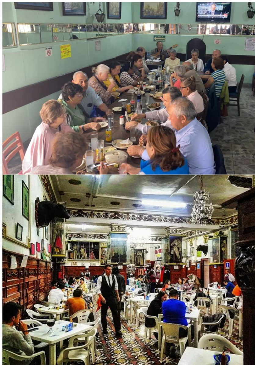
Figura 2. Comensalidad y disfrute social en cantinas La Dominica y La Faena Figure 2. Commensality and social enjoyment in La Dominica and La Faena canteens