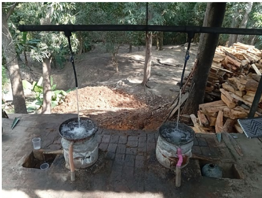
Figure 3. Clay pot stills in the tachica La Huerta