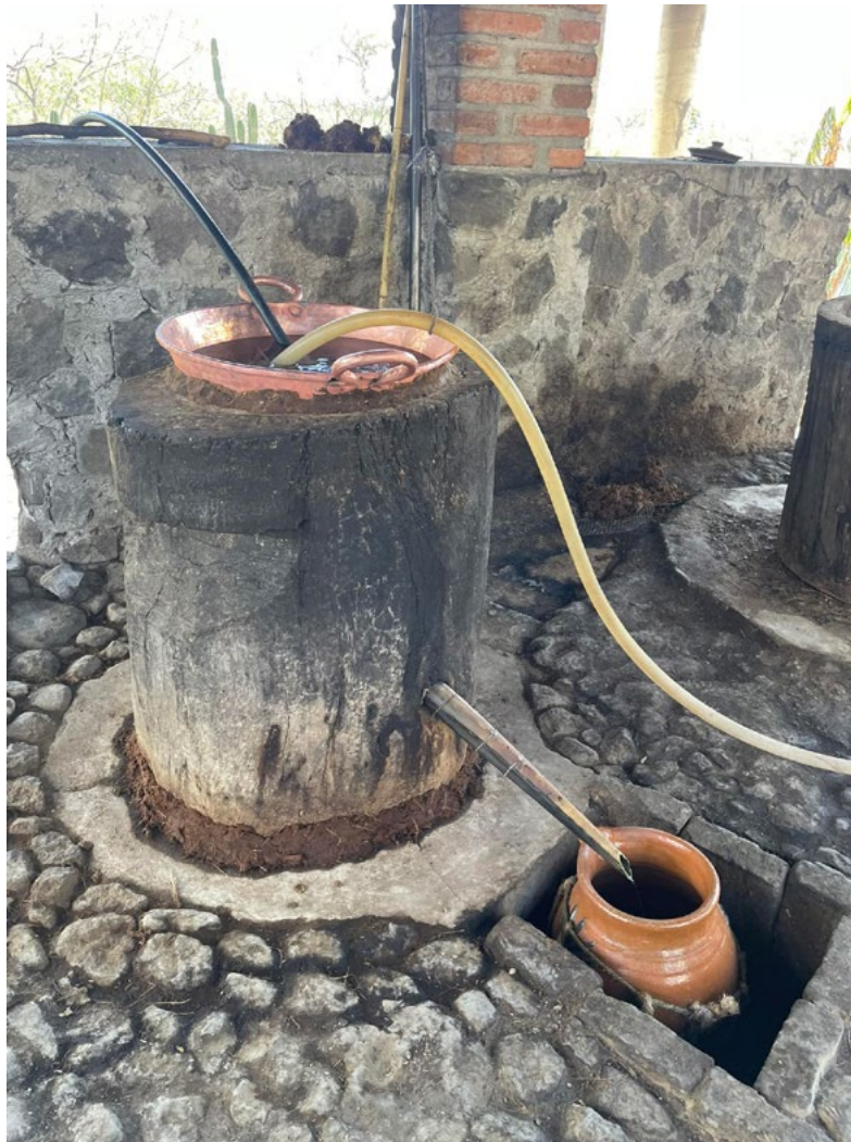
Figura 2. Destilador filipino o de influencia asiática en la taberna de Chacolo Figure 2. Filipino or Asian-influenced still at Chacolo Tavern