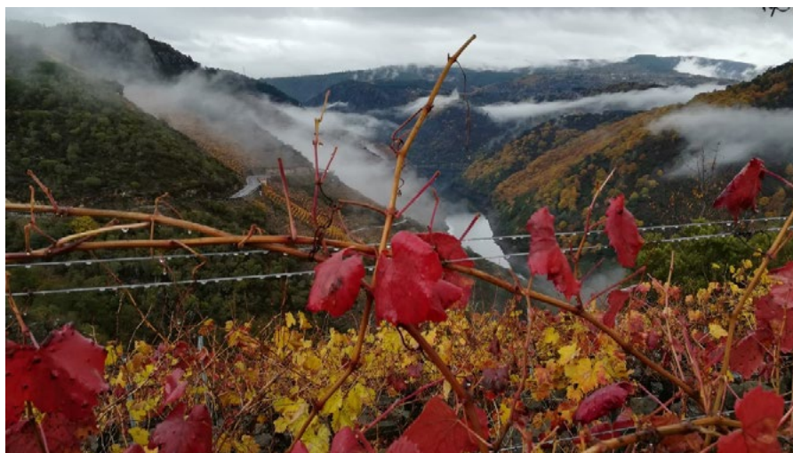
Figura 1. Doade-Sober Figure 1. Doade-Sober