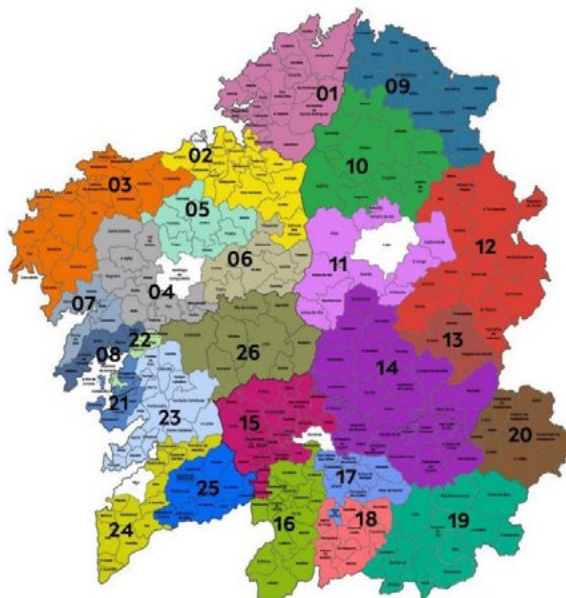
Figura 4. Mapa de geodestinos de Galicia Figure 4. Geodestiny's map of Galicia

En su versión más amplia, el Consorcio de Turismo Ribeira Sacra agrupa 26 municipios que conforman el Geodestino número 14. Por su parte, la Denominación de Orixe divide el territorio en función de las subzonas de producción (Figuras 4 y 5).