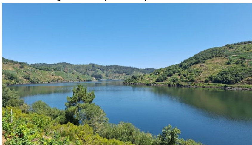
Figura 3. Parroquia de Pesqueiras-Chantada Figura 3. Parroquia de Pesqueiras-Chantada