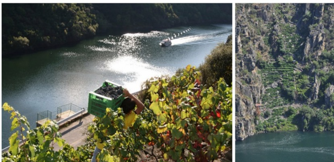
Figura 2. Viticultura heroica Figure 2. Heroic viticulture

cleos de población y no solo de aquellos con entidades medianas —villas— sino también con respecto a las parroquias que aglutinan las pequeñas aldeas o lugares. Ello explica que a la ribeira «se va» y, habitualmente, «se baja»; expresiones ambas que distancian este lugar del territorio habitualmente transitado: la ribeira es allí donde no se reside ni se vive. Esta percepción puntual para el hecho ribeirao también estaba reforzada por la propia cantidad de terreno dedicado a la producción de uva en la zona. Como ejemplo, puede observarse lo ocurrido en el ayuntamiento de Quiroga, que pasó de 160 hectáreas registradas en el año 2005 a 236,43 hectáreas en 2019. La continua roturación de terreno para vides ha incrementado la superficie vinícola: solo la bodega Rectoral de Amandi impulsó la plantación de 30 hectáreas en una única actuación. Las cifras en bruto resultan aún más abrumadoras: de los 19 ayuntamientos de la DO, apenas cinco —Quiroga, Sober, Pantón, O Saviñao y Chantada— se reparten las tres cuartas partes de las 1.250 hectáreas de viñedo (Rodríguez, 2020).