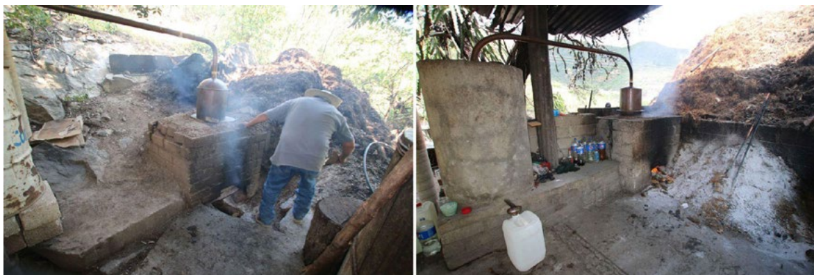
Figura 2. Destilando Caltepec, octubre de 2022 Figure 2. Distilled Caltepec, october 2022