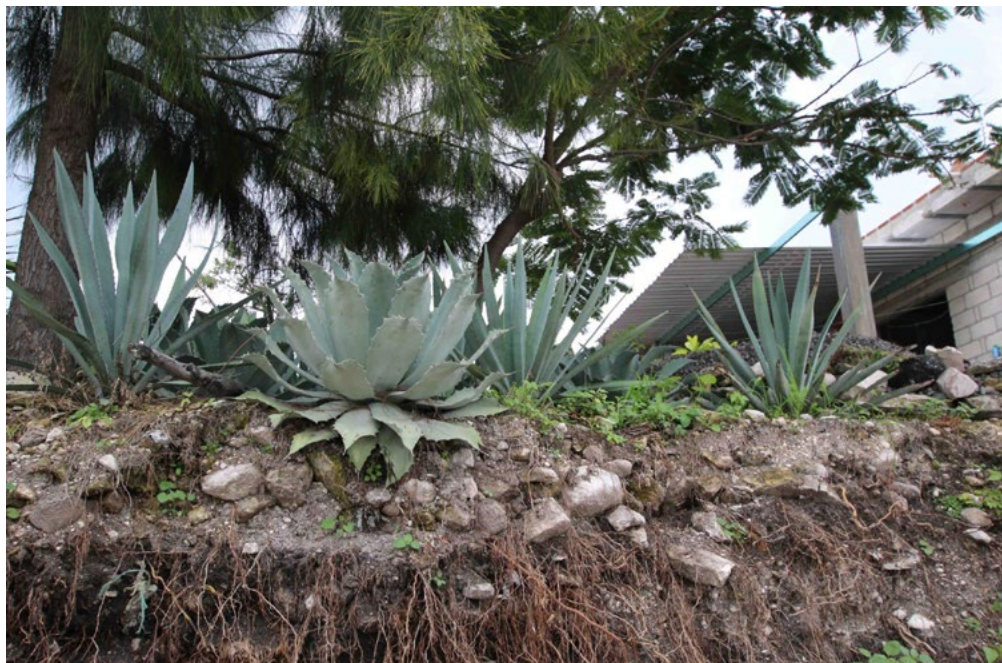
Figura 3. Maguey Papalometl and Espadilla, San Diego la Mesa, Tochimiltzingo, september 2014