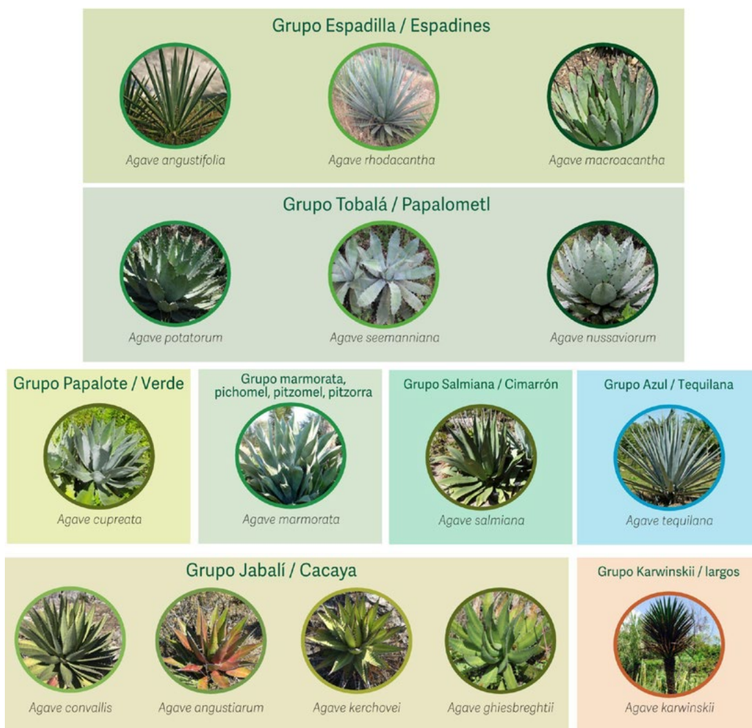
Figure 4. Groups of agaves