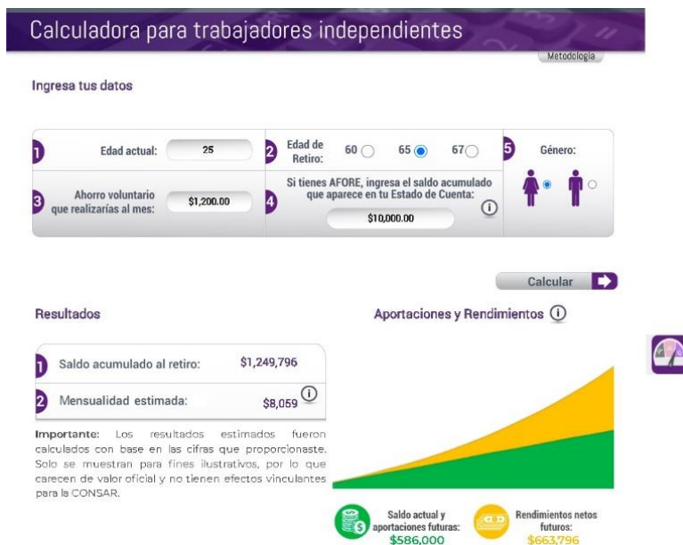
Figura N°10. Calculadora para trabajadores independientes.