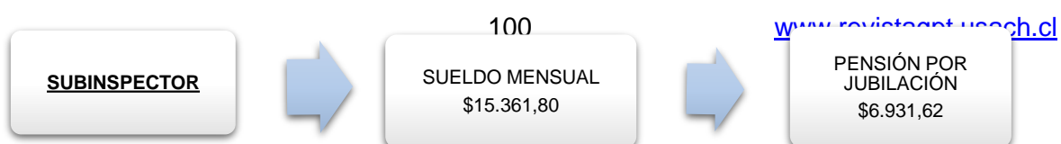
Figura N°7. Sueldo y Pensión de un elemento de la SSP con categoría de SUBINSPECTOR

El pago de la pensión por jubilación se hará por la cantidad equivalente al cien por ciento del sueldo regulador, alguien podría pensar que en el primer caso la pensión por jubilación (la cual es mensual) sería de $15.361,80 mensuales, sin embargo, no es así, de acuerdo a la Ley del IPE al establecer el cien por ciento del sueldo como pago de pensión por jubilación, no se refiere al sueldo y las demás percepciones, sino única y exclusivamente al pago del SUELDO, ver Figura N°7 y Figura N°8 .