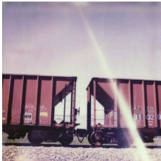
Figura 2. Trenes de carga cruzando el desierto de México Figure 2. Freight trains crossing the Mexican desert

imágenes, los vagones metálicos de la «Bestia» trenes de carga larga donde cerca de medio millón de migrantes saltan sobre sus techos para pasar la frontera hacia los Estados Unidos. La bestia es una de las opciones más viables a la vista de los migrantes, principalmente porque es «gratis» y porque les permite evitar numerosos puestos de control migratorio. Sin embargo, los riesgos son muy altos, pues los migrantes deben subir a cualquiera de los trenes hacia distintos puntos de la frontera como Tijuana, Ciudad Juárez o Matamoros para poder pasar a los Estados Unidos. Podemos encontrar también, al final del libro, algunas fotografías de aviones mercantiles que son utilizados para deportar migrantes a sus países de origen principalmente menores de edad.