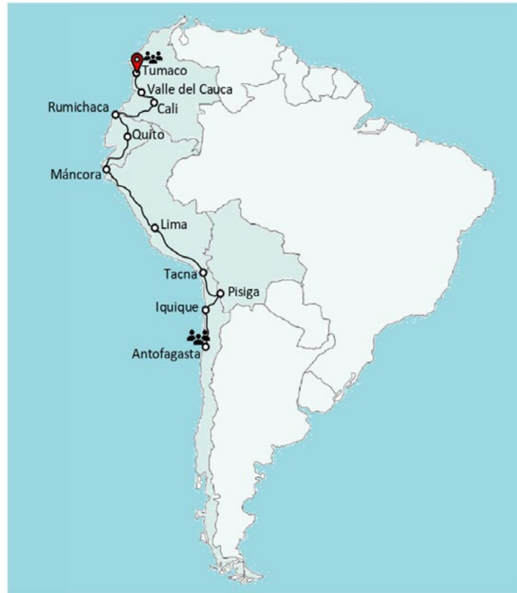
Figura 1. Ruta terrestre cruzada por la familia Parrada Castillo desde Colombia hasta Chile Figure 1. Route traveled by the Parrada Castillo family from Colombia to Chile