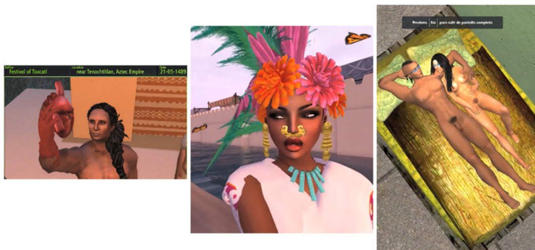
Figura 2. Fotogramas de TimeTraveller™ Figure 2. Frames of TimeTraveller™