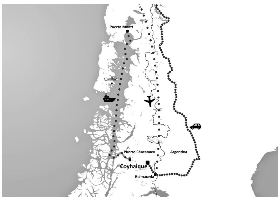
Figura 2. Accesos a Coyhaique

Esta localización remota es acompañada de una exuberante naturaleza. Las cuencas hidrográficas de Aysén conforman las mayores reservas de agua dulce de alta pureza del hemisferio, después de la Antártica. Allí se encuentra el río Baker, el más caudaloso de Chile, el lago binacional más extenso del país y una parte de los campos de hielo norte y sur (18.00 Km 2 ). La cuenca hidrográfica de Coyhaique es una de las seis de la región, las que aportan con el 29% de los recursos hídricos del país (ERDA, 2012: 42).