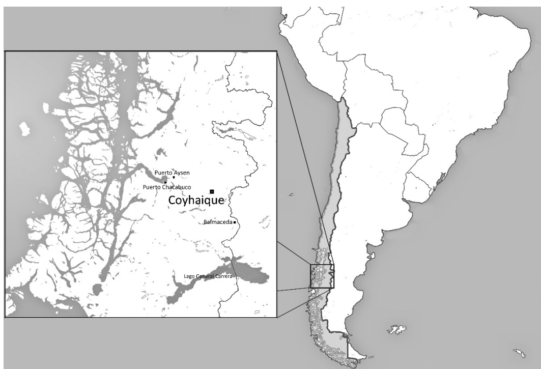
Figura 1. Localización de Coyhaique

La región de Aysén se localiza entre los 43° 38' y 49° 16' de Latitud Sur, desde los 71° 06' Longitud W hasta el Océano Pacífico, donde la geografía sudamericana cambia abruptamente su forma debido a la erosión glaciaria. La cordillera de Los Andes modifica su continuidad para dar paso a islas, fiordos, campos de hielo y praderas.