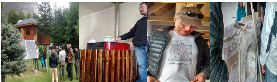
Figura 3. Miembros de Enercoop Aysén y las energías renovables

Sin estándares ni manuales, la construcción de estufas refractarias de uno de sus miembros nos mostró su entusiasmo para vincularse con tecnologías que, para el caso de la leña, advierte todo un horizonte de experimentaciones, aprendizajes y certificaciones pendiente.