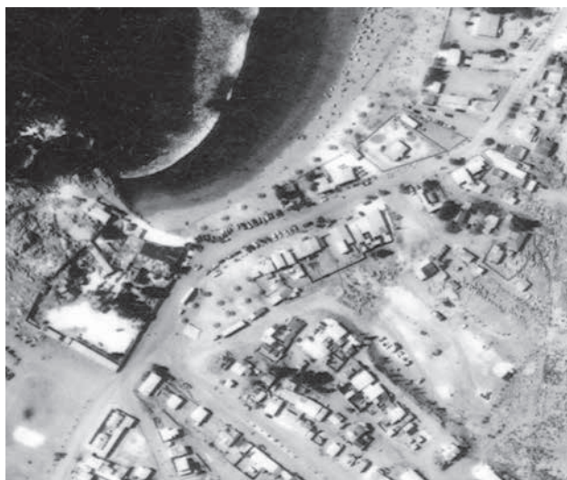
Flamenco, III región de Chile.