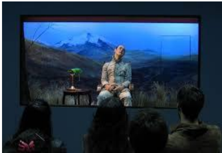
Diorama en escena Rey Planta 2006.

Los materiales del diseño teatral que acompañan a la vitrina: sillón afelpado, mesita de madera con lámpara, cortinas aterciopeladas, paisaje cordillerano, foto de la familia real, cigarros con inscripciones extranjeras, notas de prensa y plano con la escena de la masacre se transforman en recursos que por sí solos no se pueden concebir como obras artísticas, pero que articulados con el montaje teatral cumplen una doble función: verosimilitud y cuestionamiento de la representación. Además, los elementos de archivo exhiben el proceso de producción al funcionar articulados y de manera a-jerárquica produciendo una ilusión de realidad en el espectador.