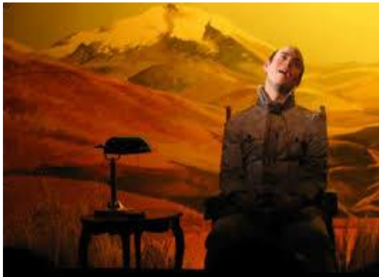
Escena Rey Planta 2006.

Como fenómeno híbrido y transmedial Rey Planta utiliza ciertas imágenes como recursos que cumplen una función de instalación. Entendiendo este proceso como la apropiación de imágenes gráficas en la puesta en escena que podrían ser comprendidas separadas del texto dramático, pero que no son entendidas fuera del discurso representacional. Un ejemplo claro de este tipo de recurso híbrido es la vitrina. Ya mencionamos en el capítulo anterior que este elemento cumplía dos funciones: la sensación de mirar y a la vez ser observado, siendo el reflejo la posibilidad de acceder a dicha práctica doble para el espectador. Sin embargo, podemos establecer otras relaciones de significación a través de la sensación de exhibición producida por la vitrina. Por ejemplo, la imagen visual de mamushkas genera la concepción de museo dentro del museo, componente híbrido que asocia la idea de obra instalación en base al concepto de vitrina como ilusión de realidad.